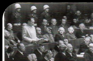
▲被告席のゲーリング。