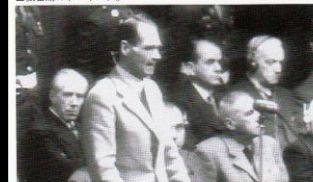
▲被告席のルドルフ・ヘス。