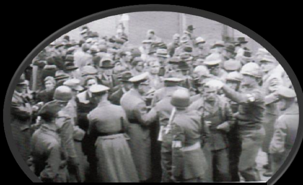
米英仏ソ4か国に占領されたベルリン