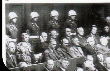
右▼被告席のヘルマン・ゲーリング国家元帥とリッペントロップ外相。