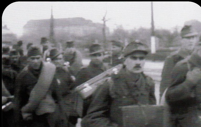
降伏するドイツ軍