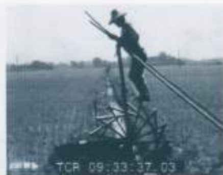
映画『日本の農村』「自作特別措置法」の農林省ポスター 1947.