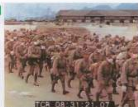
復員兵、大竹に到着 1946.3.9