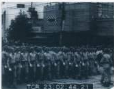
陸軍参謀総長アイゼンハワー元帥、アイケル バーガー第8軍司令官とともに装甲車で遊園 1946.3.12