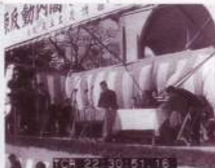
徳田球一と梶原の対決 1946.3