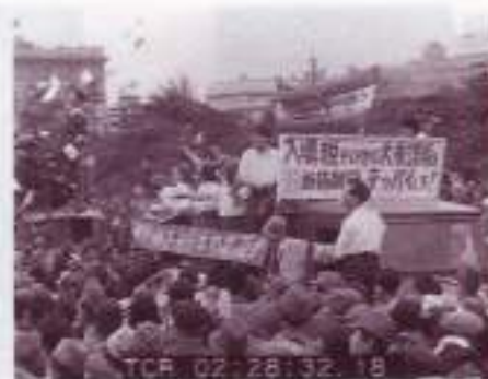
戦後初のメーデー(東京) 1946.5.1