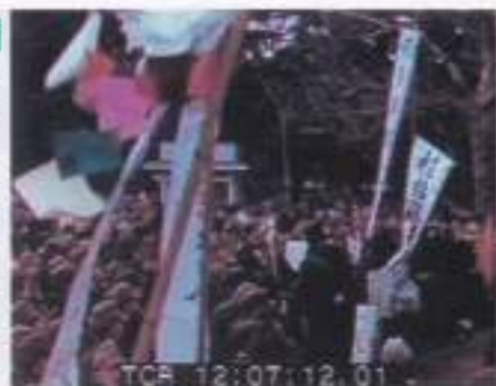
日比谷音楽堂、教員組合の集会 1945.1.2