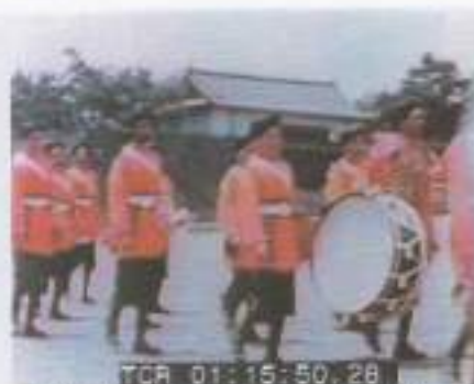
皇居前を進駐する連合軍(インド軍) 1945.11