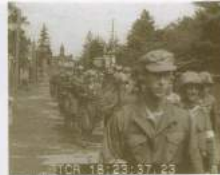
青森市内を進駐する第81師団 1945.9