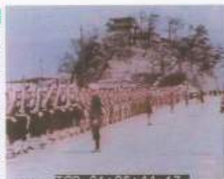
各地に進駐する連合軍(英国軍) 1945.11