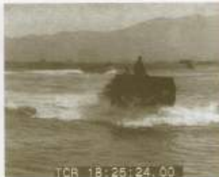
青森に上陸する第81師団 1945.9