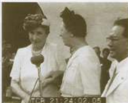
ヘレン・ケラー女史、来日 1948.9.6