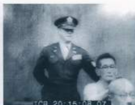
大川周明、東条英機の頭を叩く 1946.5.3