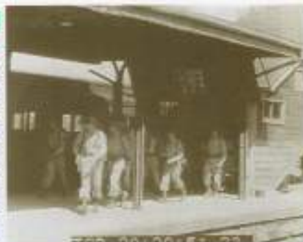
千葉県館山に進駐する連合軍 1945.9.5