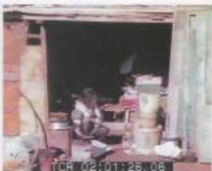
被災は受けなかった京都だが、苦しい生活は同じであった 1946.12