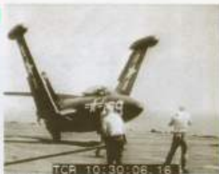
空母から発進する、B29ジェット戦闘機 1950.6