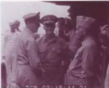
降伏調印式、戦艦ミズリー号に乗り込むマッカーサー元帥 1945.9.2