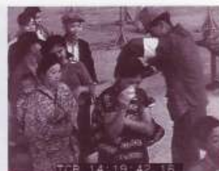
大陸からの引揚者、D O T 配布 1947.10.24