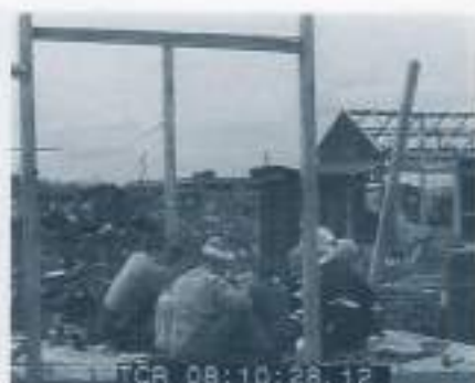
ガレキの中での食事風景(横浜) 1945.9.4