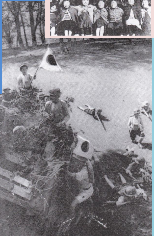
→神社での奉仕作業（「千葉県市川市中山小学校」）