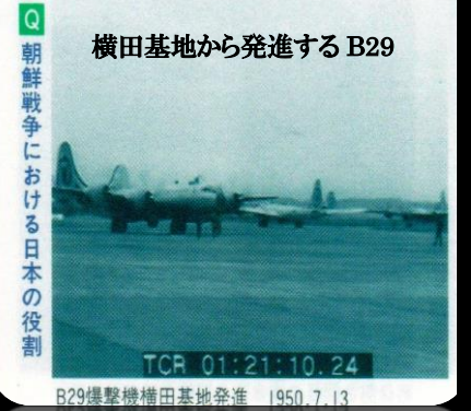
横田基地から発進する B29