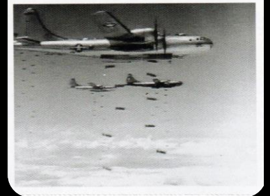
横田基地から発進した B29 爆撃機 無差別絨毯爆撃の様子