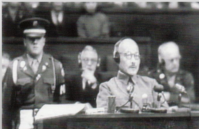
極東国際軍事裁判のハイライトシーン、1947年12月26日午後、 元首相・東条英機被告人台に着席、宣誓供述書の朗読に耳を傾ける。