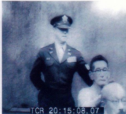
大川周明、東条英機の頭を叩く 1946.5.3 東京裁判、A級戦犯への「厳しい判決」