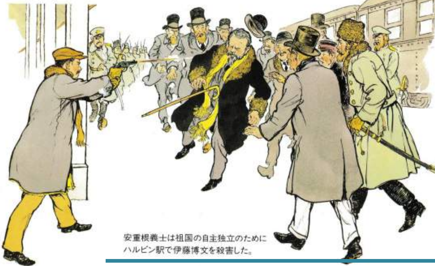
安重根義士は祖国の自主独立のためにハルビン駅で伊藤博文を殺害した。

大韓民国の樹立／朝鮮戦争－同族の悲劇／4・19義挙と5・16軍事クーデター／第5共和国／第6共和国 付録王朝の系譜