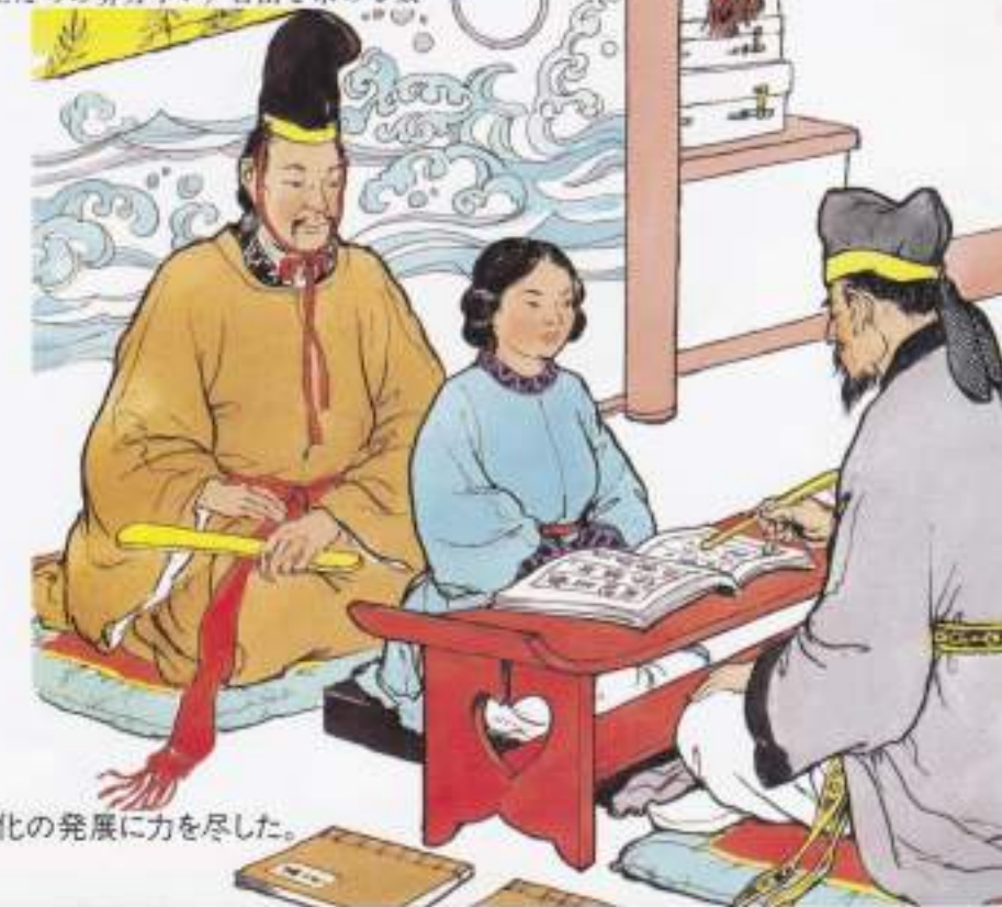
日本の太子の師となった王仁博士は、日本文化の発展に力を尽した。